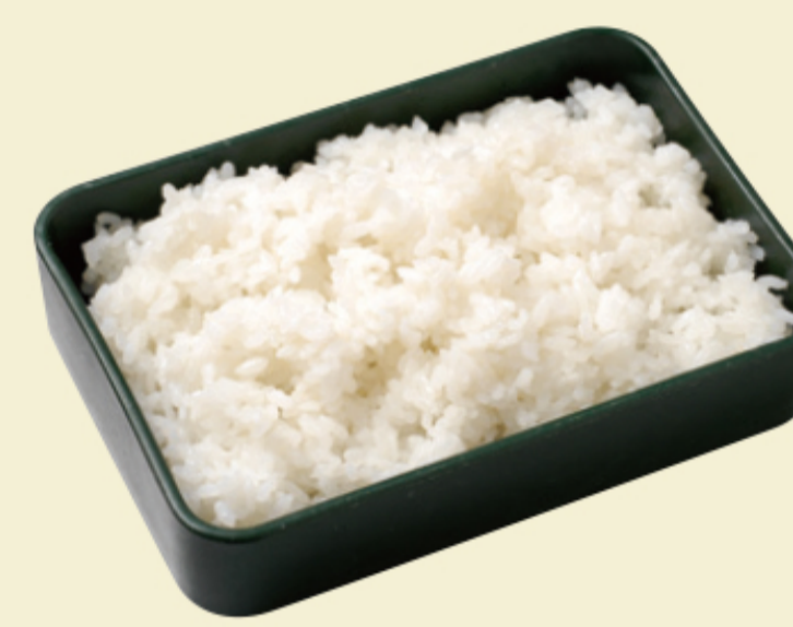
ごはん中 茶碗約2杯 140円