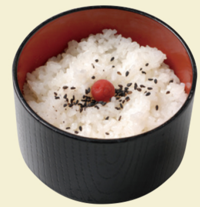
幕の内ごはん 茶碗約2杯 150円