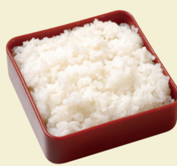
ごはん小 茶碗約1杯半 100円